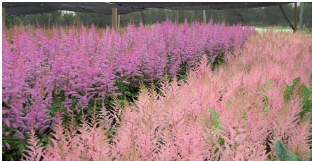
Cultivo de astilbe

No obstante, cabe señalar que existen varios aspectos claves que influyen en la viabilidad del negocio de las flores, por ejemplo, la especialización y conocimiento que alcancen los productores